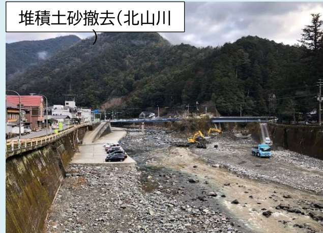
堆積土砂撤去(北山川)

河川の氾濫の原因となる川床上昇を防ぐため、新宮川(熊野川)水系の北山川、小椽川流域の堆積土砂撤去について、奈良県及び電源開発株式会社に要望を行い、堆積土砂の撤去工事を実施して頂いています。(令和5年度予定の撤去土量: 2,800m 3 )