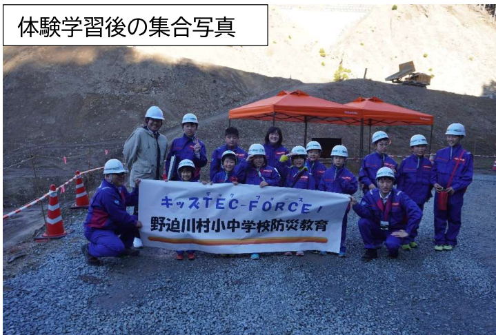
体験学習後の集合写真