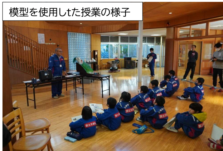
模型を使用した授業の様子